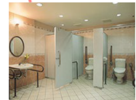
トイレ (男性：個室2、女性個室3)