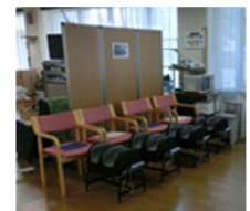
フットマッサージ機と全身マッサージ機もご用意しています